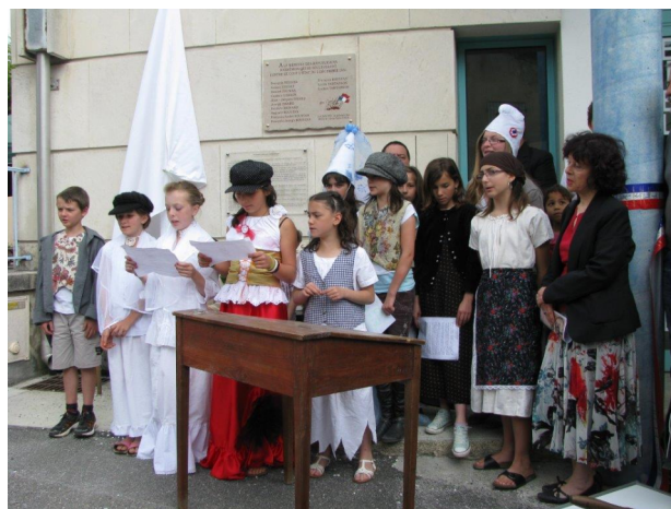
Spectacle et inauguration de la Plaque à Barrême.

en visitant la maison du grand homme et notamment une belle exposition : "Victor Hugo l'homme politique". Ils sont prêts, maintenant, pour de nouveaux projets.