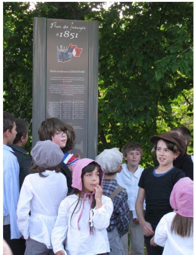
Inauguration de la Plaque à Montfort.

– Dans chaque commune nous avons participé à l'inauguration de plaques en hommage aux Républicains insurgés arrêtés et désormais honorés sur la place publique.