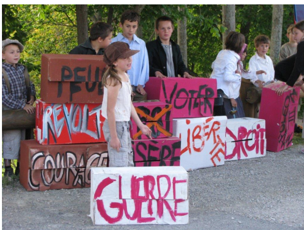
Spectacle à l'école de montfort.

Et une fois de plus, dans chaque manifestation des participants ont trouvé là, l'occasion de parler de leur mémoire familiale et même de la partager avec notre association grâce à des documents d'archives qu'ils nous ont offerts ou que nous leur avons indiqués.