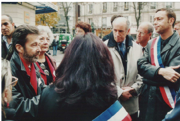
2 décembre 2001 rue du faubourg St-Antoine à Paris

(voir l'article publié dans notre bulletin n° 19, intitulé : “Chronique d'une célébration parisienne”).