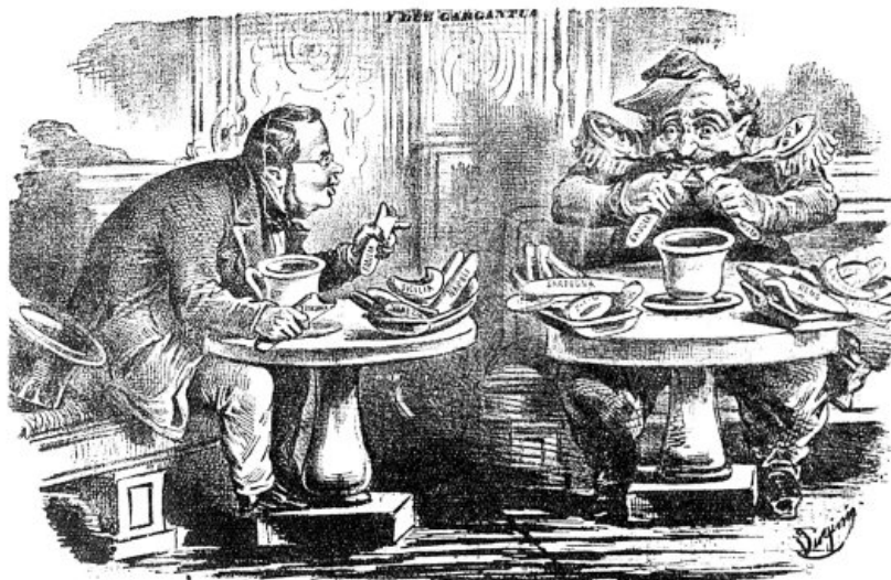
Les deux Gargantua. Cavour dévore la Toscane et l'Emilie et a sur son assiette la Sicile, Venise et Naples. Napoléon III en fait autant de la Savoie et de Nice et attend d'avaloir la rive gauche du Rhin et la Sardaigne. Cavour : "Hé, l'ami ! Tu m'as traité de Gargantua et de dévorant, mais plus je t'observe, plus je vois que toi aussi tu as un très bon appétit !" Caricature du journal satirique Il Fishietto.