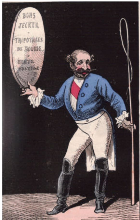
LES SOUTIENS DE L'EMPIRE, Le duc de Morny

Les ministres de l'Intérieur et de la Guerre sont chargés de l'exécution du présent décret et de celle sommaire des citoyens à qui il ne conviendrait pas"